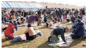
道具・材料は準備します