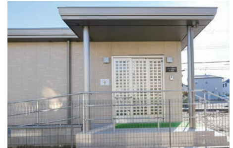
ときわ台自治会集会所 (宮和田 971-10)

ときわ台自治会は、宝くじ助成を受けて、集会所を新築しました。(一財)自治総合センターでは、宝くじの社会貢献広報事業として、宝くじの受託事業収入を財源としたコミュニティ助成事業を実施しています。この集会所の完成により、地域のコミュニティ活動の活性化が期待されます。