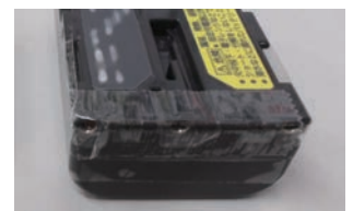
モバイルバッテリー(小型充電式電池)の絶縁処理例