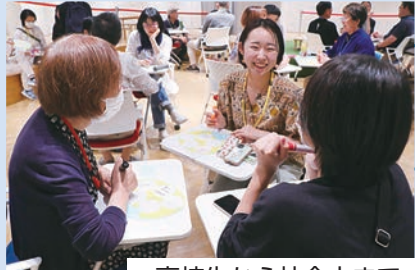
高校生から社会人まで幅広い年代の方が活躍中!