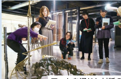
アートを通じた対話の場づくりを学べます