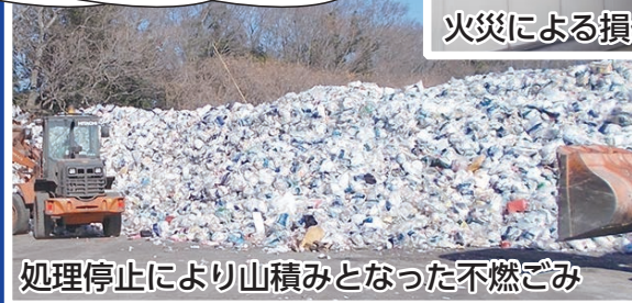
処理停止により山積みとなった不燃ごみ