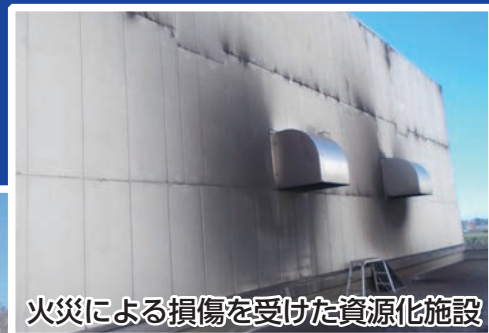
火災による損傷を受けた資源化施設