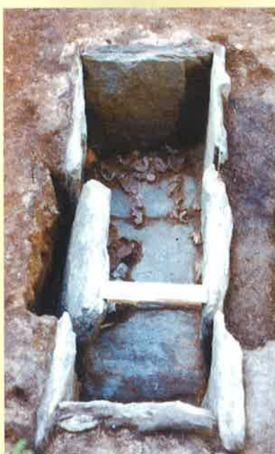
市之代6号墳石棺発掘風景