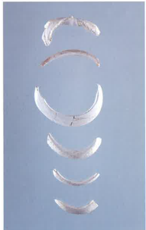
ベンケイガイ製貝輪（中妻貝塚出土）