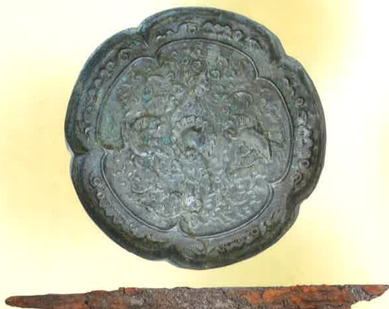
瑞花双鳳五花鏡と刀子(下高井向原I遺跡出土)