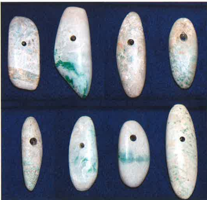
ヒスイ製大珠（茨城県常陸大宮市坪井上遺跡出土）常陸大宮市教育委員会所蔵 上段左より2点目と下段右より2点目を展示、その他はパネル展示