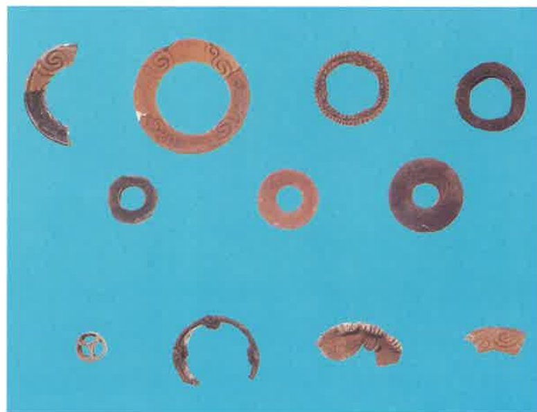
土製耳飾（上2段：中妻貝塚出土 下段：神明遺跡出土）