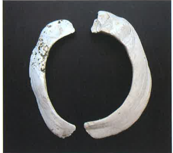
カキ製貝輪（西方貝塚出土）