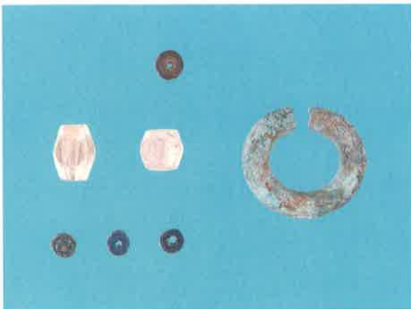
市之代8号墳出土副葬品 水晶玉・耳環など（パネル展示）

また、非常に珍しいことですが、取手市の大山I遺跡では、古墳時代の住居の跡から銅鏡の重圏文鏡が出土しました。銅鏡は権力を表す貴重品と考えられており、住居跡から出土する例は非常に珍しいものです。残念ながら、発掘調査ではその謎を解き明かすことが出来るような資料は出土しませんでした。取手市にとって貴重な出土資料のひとつです。