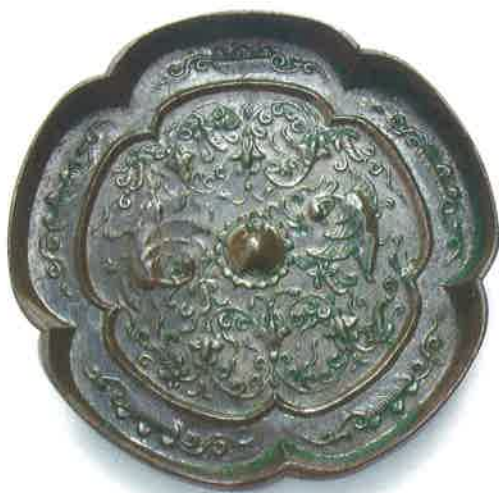
船橋市指定文化財「瑞花双鳳五花鏡」現品 (千葉県船橋市印内台遺跡群出土) (パネル展示)

同じ瑞花双鳳五花鏡と刀子が、同じように土坑墓から発見されたのが、印内台遺跡群（千葉県船橋市）です。この土坑墓からは、鏡を収める はこ 篋の一部も一緒に発見されました。鏡と鏡篋 かがみぼこ が一緒に出土する例は非常に珍しく、当時の風習文化だけでなく、漆工技術を知る上でも大変貴重な資料となっています。