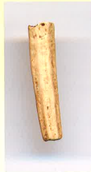
ツノガイ製貝玉(神明遺跡)