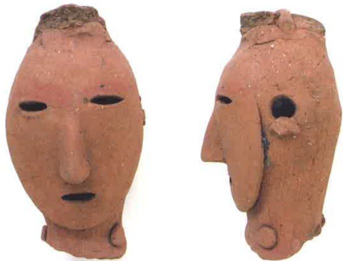
人物埴輪（市之代3号墳出土）