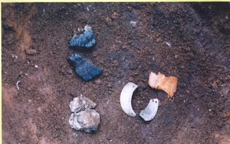
サルボウ製貝輪出土状況(神明遺跡)