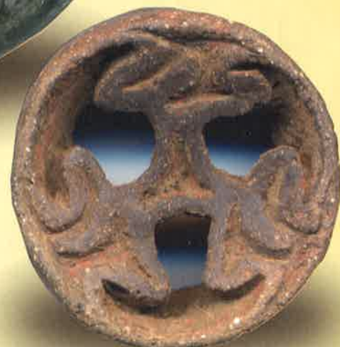
土製耳飾(神明遺跡出土)