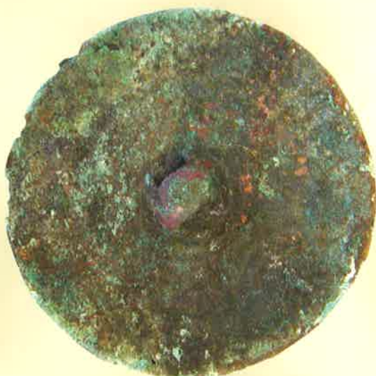
重圈文鏡(大山I遺跡出土)