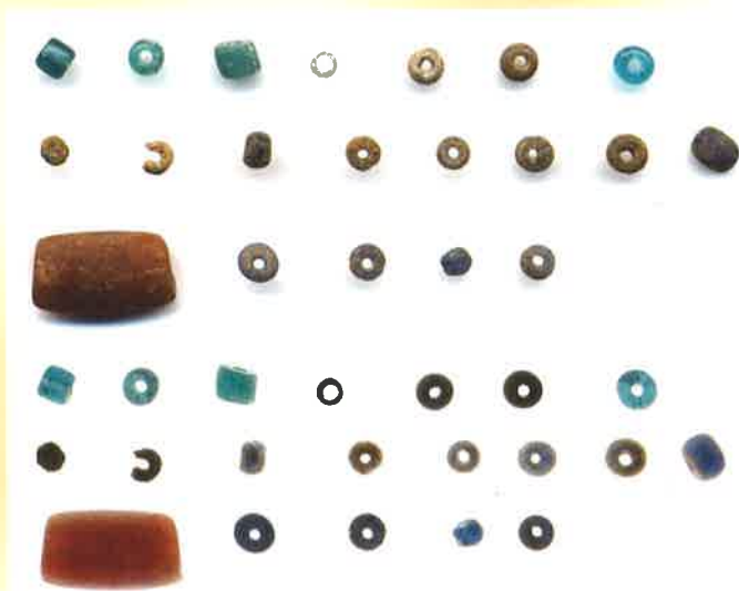
ガラス玉(市之代6号墳出土)