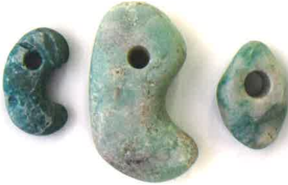
ヒスイ製勾玉と垂飾（神明遺跡出土）

取手市でも、神明遺跡からヒスイ製の勾玉が2点とネックレスの装飾に使った垂飾 たれかざり が出土しています。