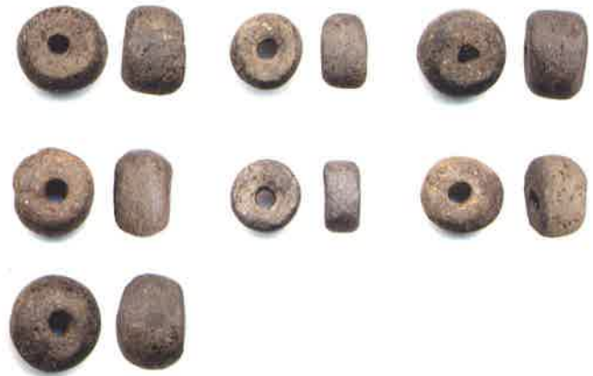
土玉（市之代6号墳出土）