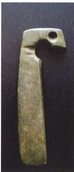
玦状耳飾（西片貝塚出土）

取手市でも、取手を代表する遺跡である中妻貝塚（縄文時代中期～後期）や神明遺跡（縄文時代後期～晩期）で多数の土製耳飾が出土しています。