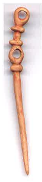
ヘアピン（神明遺跡出土）