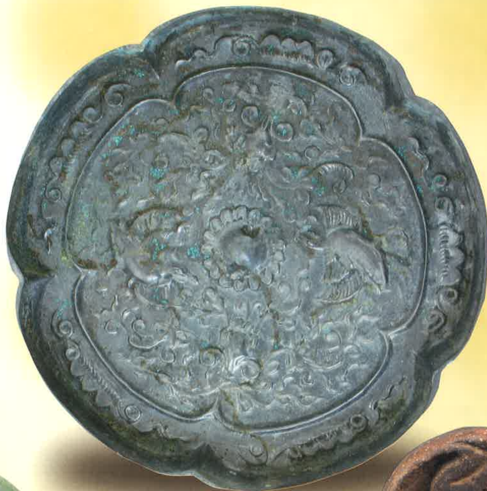
瑞花双鳳五花鏡(下高井向原1遺跡出土)

休館日 月曜日、ただし2月22日(月)、3月21日(月・祝)、4月18日(月)は臨時開館