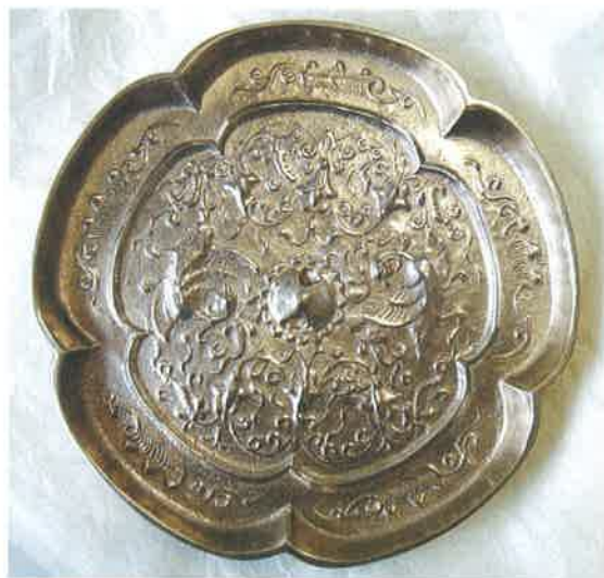
「瑞花双鳳五花鏡」復元模造品