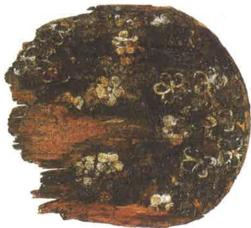
船橋市指定文化財「梅花文鏡篋(残欠)」現品 (千葉県船橋市印内台遺跡群出土) (パネル展示)