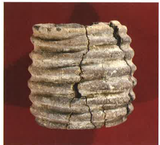
貝輪型土製品（栃木県高根沢町荻ノ平遺跡出土） 栃木県教育委員会所蔵