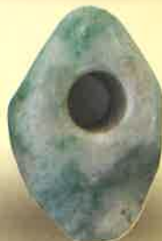
ヒスイ製勾玉・垂飾(神明遺跡出土)