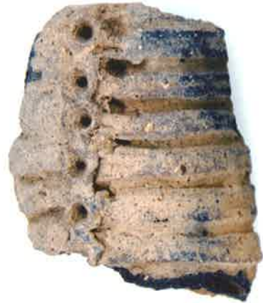
貝輪型土製品（茨城県ひたちなか市三反田蛸塚貝塚） ひたちなか市埋蔵文化財調査センター所蔵