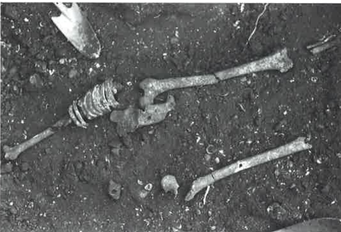
ベンケイガイ製貝輪出土状況 ひたちなか市埋蔵文化財調査センター所蔵（パネル展示）