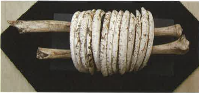
ベンケイガイ製貝輪（茨城県ひたちなか市三反田蛸塚貝塚出土） ひたちなか市埋蔵文化財調査センター所蔵（パネル展示）

また、ヒスイなどと同様に、遺跡周辺では採取できない素材の装身具も出土する場合があります。中妻貝塚からは、房総半島以南に生息するイモガイを加工した玉やその未成品が出土しています。これらの出土分布を辿ることで、縄文時代の流通状況がかなり発達していたことが見えてきます。また、このような手に入りにくい希少な装身具を身につけていた人は、一体どのような人物だったのでしょうか。権力者だという説や呪術を司るシャーマン的な人物だったという説などがありますが、今後の研究成果に大いに期待したいものです。