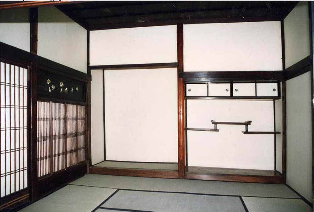
上段の間 (右から天袋と違棚、床間、平書院)