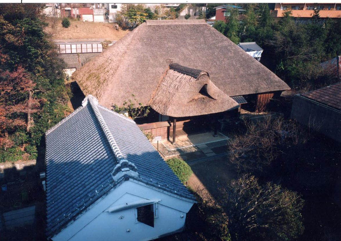
主屋 (右奥) と土蔵 (手前左)