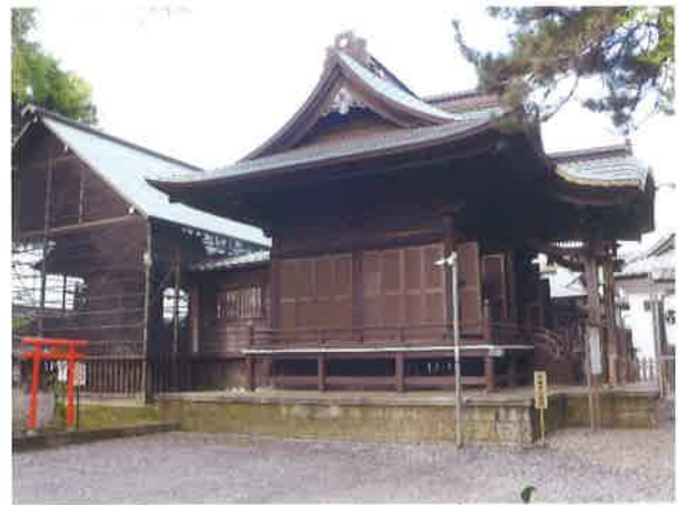
八坂神社拝殿（右）と本殿（左）