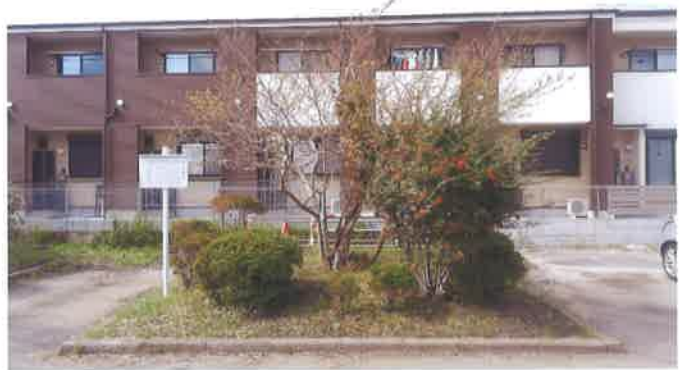
旧藤代宿本陣の玄関左にあったサルスベリ