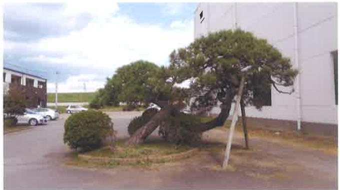
旧藤代宿本陣の玄関右にあった松

時代は大名行列が街道を行き来した近世から、先の将軍や水戸藩主が気軽に汽車に乗って狩猟を楽しむ近代へと、確実に変化を遂げていったことを象徴する出来事と言えるでしょう。