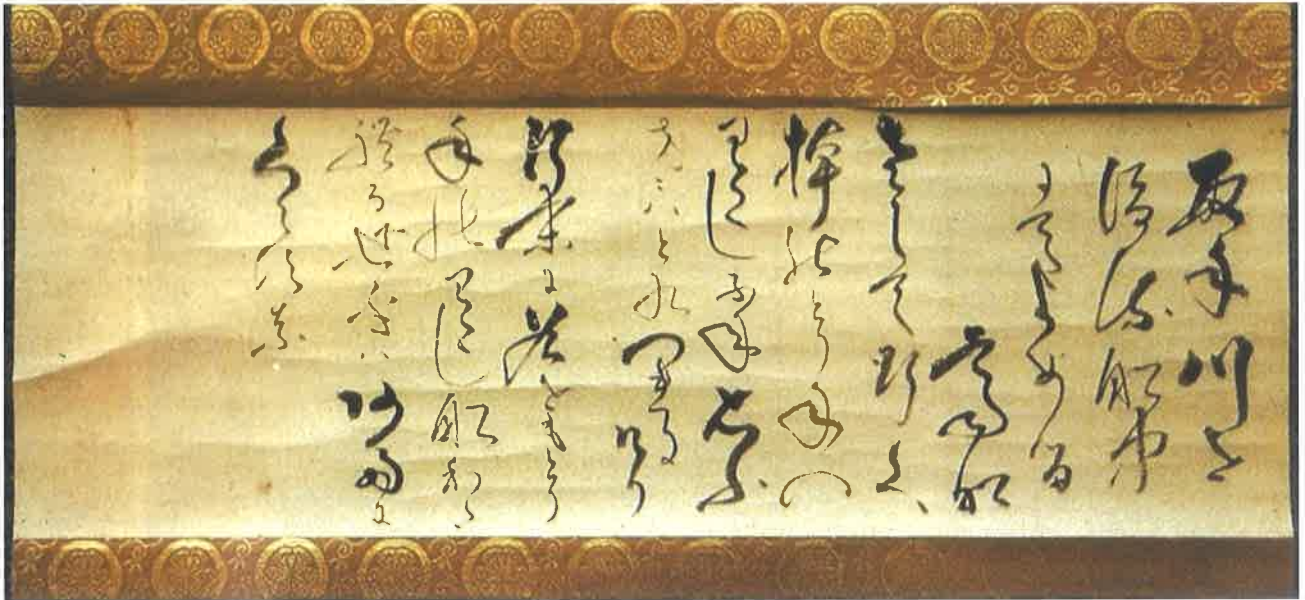
徳川斉昭が利根川を渡る船中で詠んだ和歌

ハ あたにくらすな」です。和歌を書いた紙は後にはがされ軸装されて、やはり本陣のご子孫宅に伝えられています(染野修氏所蔵、通常は非公開)。