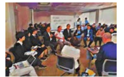
車座による意見交換会

取手市議会では、市民の皆さんとさまざまなお話をする意見交換会を定期的に行っています。議員と直接お話ししてみませんか。日時など詳細は議会報「ひびき」やFacebookなどでお知らせしていきます。ぜひご参加ください。