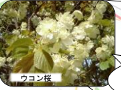
全国でも珍しい黄色い桜。開花の日は短いので注意。