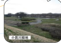
各種健康遊具やバーベキュー場もある。近くにはボニーがあるのでサイクリング中に会えるか