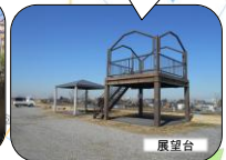
天気の良いと南に富士山、北に筑波山が