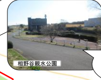
利根川の支流の相野谷川の自然も感じながら一休み。