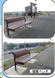
健康ベンチで一休み