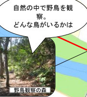
自然の中で野鳥を観察。どんな鳥がいるかは