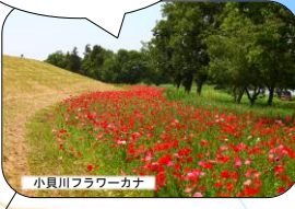
春にはポピー、秋にはコスモスが色鮮やかに咲く。