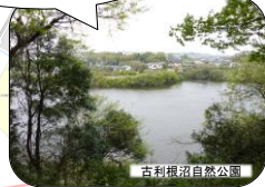
古利根沼自然公園