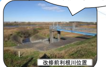
100年前の利根川改修工事の跡