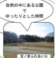
自然の中にある公園でゆったりとした時間