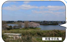
関東3大堰の1つ。茨城百景にも選定された名所。