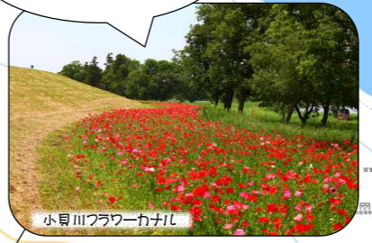
小貝川フラワーカナル