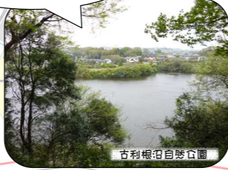
古利根沼自然公園