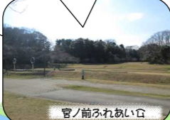
宮ノ前ふれあい広

ここで自転車を借りて スタート！貸出期間は 3月20日～11月30日まで の土日祝。9時～16時。