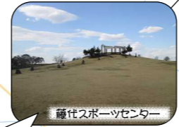
藤代スポーツセンター