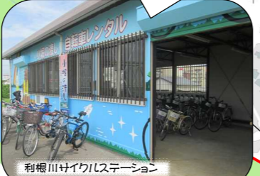
利根川サイクリステーション

ここで自転車を借りて スタート！貸出期間は 3月20日～11月30日まで の土日祝。9時～16時。