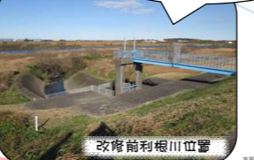
改修前利根川位置