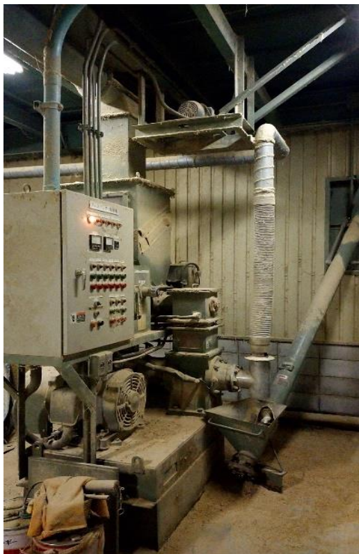
籾殻膨軟化装置(プレスパンダー)