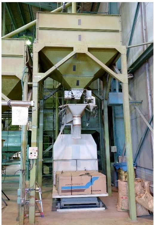
フレコンタンク及び計量機