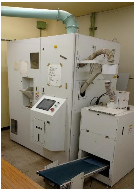
自動自主検査装置