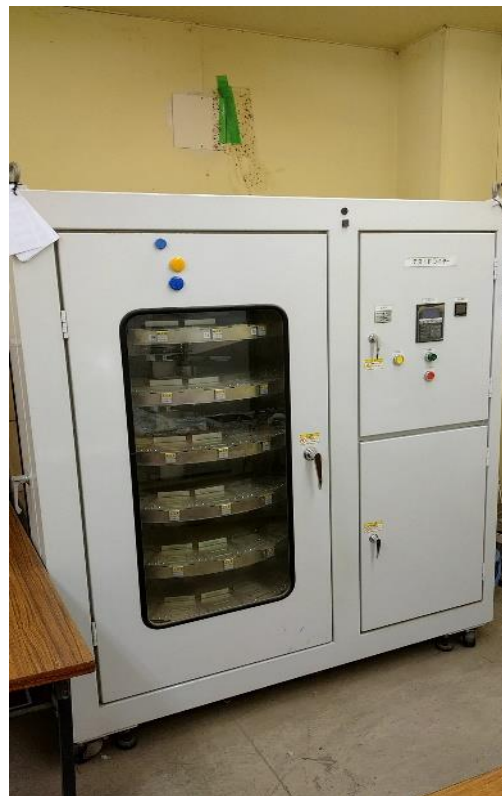
テストドライヤー