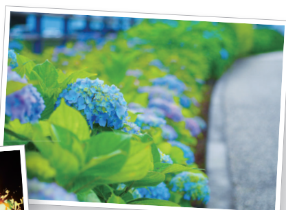
ゆめみ野公園のアジサイ