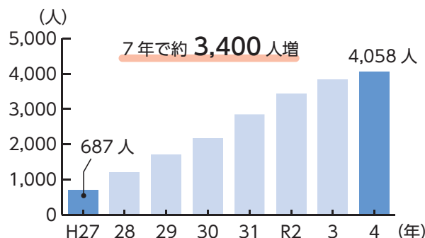
ゆめみ野地区の人口の推移（各年1月1日時点）