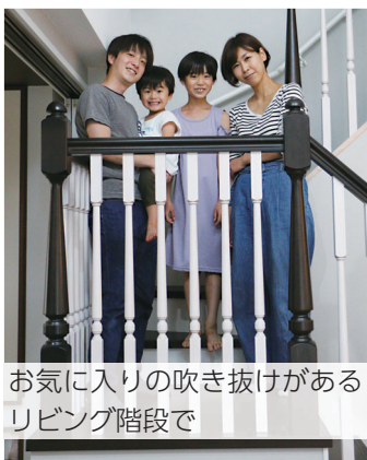
お気に入りの吹き抜けがあるリビング階段で