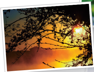
岡堰から見た朝日