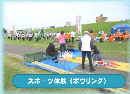
スポーツ体験 (ボウリング)