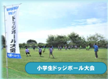
小学生ドッジボール大会